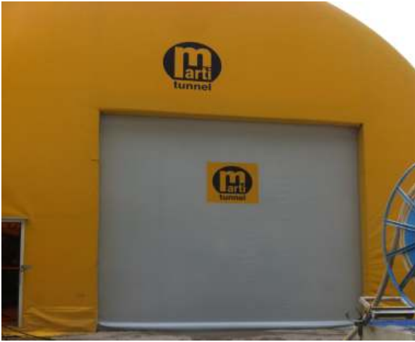
Mit Firmenlogo bedrucktes Lager-Rolltor