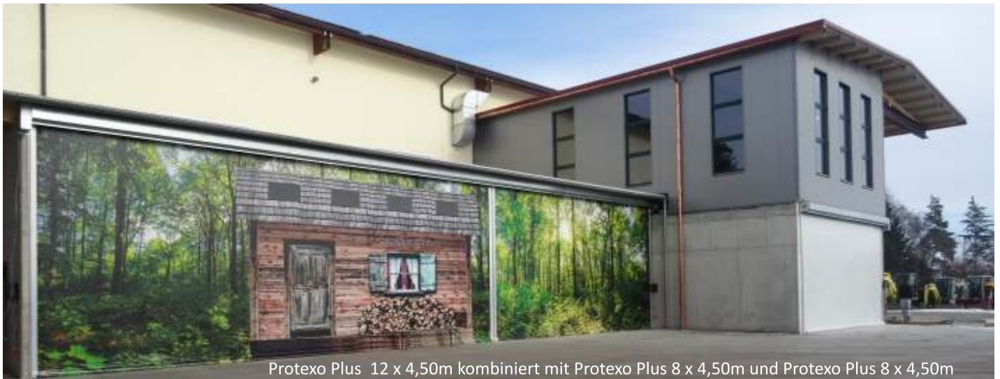
Protexo Plus 12 x 4,50m kombiniert mit Protexo Plus 8 x 4,50m und Protexo Plus 8 x 4,50m

Optional können die Tore mit einem Laser Absicherungssensor ausgestattet werden. Damit öffnet das Tor sowohl bei Bewegung im Erkennungsbereich als auch bei Berührung mit einem virtuellen Drucktaster.