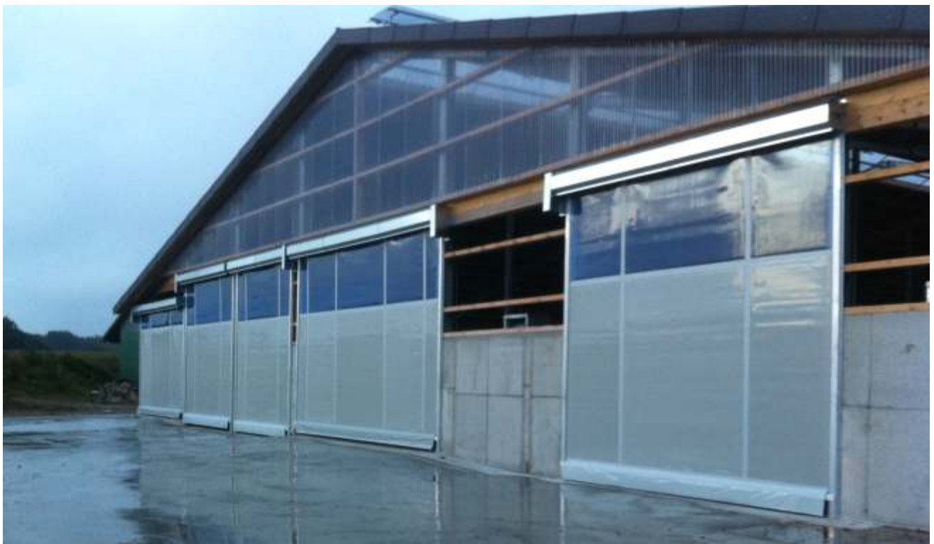
Landwirtschaftliche Tore mit schwerem Behang (6000g/m 2 ) für Bauten in Starkwindlagen