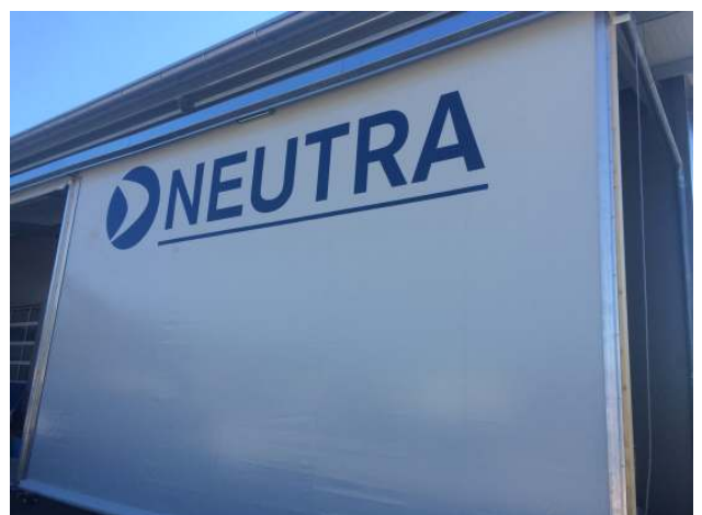
Gewerbetor mit Firmenlogo im Siebdruck