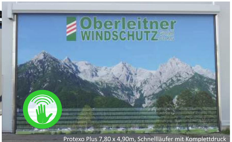
Protexo Plus 7,80 x 4,90m, Schnellläufer mit Komplettdruck