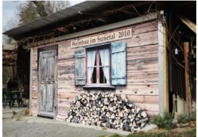
Vollflächig bedrucktes Gerätehaus-Rolltor