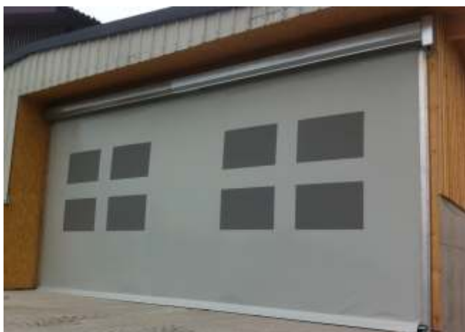
Gewerbetor mit Netzfenstern zur Belüftung